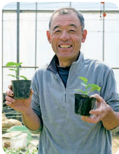
地方とは異なる東京ならではの農業経営を確立し、次世代へつなげている

都内では夏の暑さが厳しく、生育が難しい冷涼地向け野菜の生産にも挑戦している。さまざまな暑熱対策を駆使し、この場所でやりたいと話す。今後の目標を訊ねると、「指導だけでは物足りない。体力が続く限り野菜を作り続けたい」と笑った。