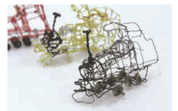
東恩納 侑(無題)2005年頃 作家蔵

6月26日まで。「線」をテーマに、ローザンヌのオール・ブリュット・コレクションなど世界の名だたる美術館に作品が収蔵されている作家を含む、10人の作品を紹介。 同ギャラリー ☎03-5422-3151