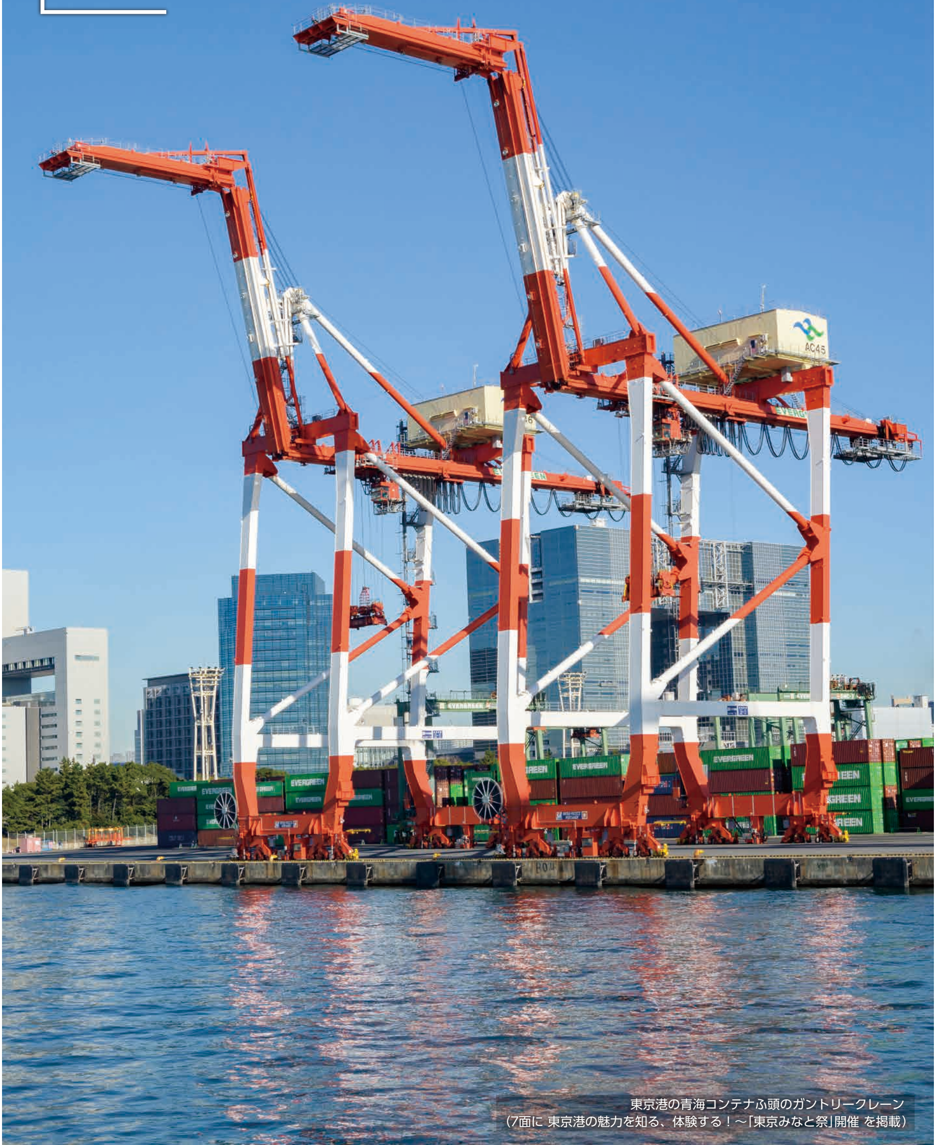
東京港の青海コンテナふ頭のガントリークレーン (7面に 東京港の魅力を知る、体験する！～「東京みなと祭」開催 を掲載)