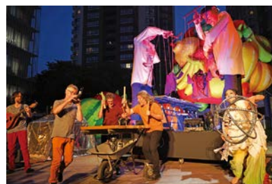
六本木アートナイト ©六本木アートナイト実行委員会