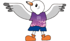
とうきょう総文2022 大会マスコットキャラクター ゆりーと

お問い合わせ 同文化祭東京都実行委員会事務局 (教育庁指導企画課内) ☎03-5320-7474 HP