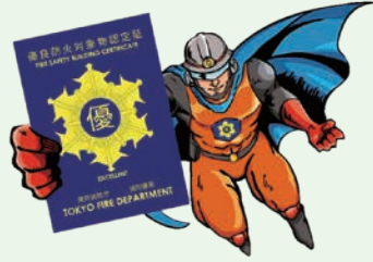
イメージキャラクター「優マークマン」と「優マーク」

公式アプリまたはホームページでは、認定を受けた建物とともに、「消防設備が設置されていない建物」「違反を繰り返す建物」を地図から簡単に調べられます。ぜひご利用ください。