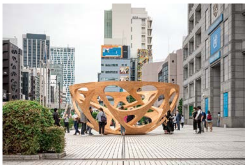
パビリオン・トウキョウ2021 Global Bowl 設計：平田晃久