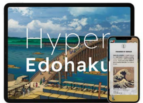
江戸東京博物館アプリ「ハイパー江戸博」