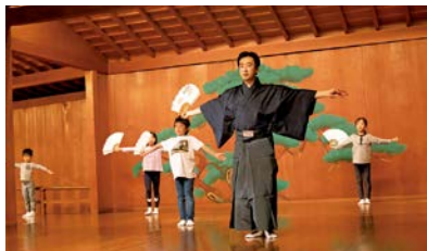
キッズ伝統芸能体験