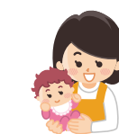
保育士は女性の仕事