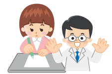
女性は文系で、男性は理系