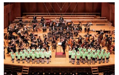
サラダ音楽祭