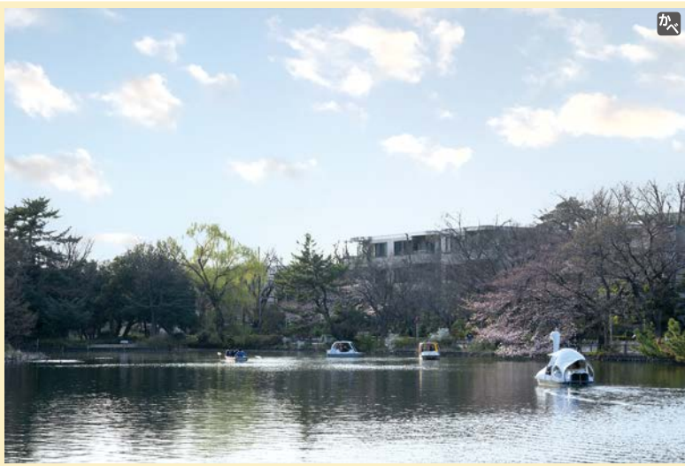
ボート遊びもできる石神井池 (4年3月25日撮影)