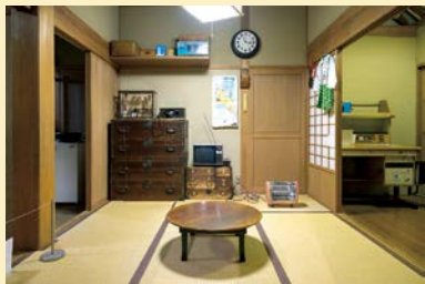
昭和時代のお茶の間を再現