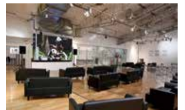
東京スポーツスクエア内