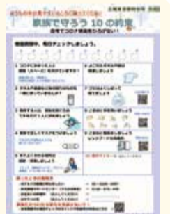
家族で守ろう10の約束